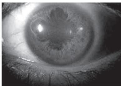
FIGURA N° 1. Aspecto biomicroscópico. Sinequias posteriores 360°

El Sx de Vogt-Koyanagi-Harada es una panuveítis bilateral que además compromete el sistema auditivo, las meninges y la piel; por esta razón debe ser conocido no sólo por el oftalmólogo sino por los demás profesionales a quienes puede presentarse un paciente con estos síntomas. Los corticoides constituyen la base del tratamiento. El pronóstico visual depende de la edad de inicio, del tratamiento instaurado y de la aparición de complicaciones como fibrosis subretiniana o neovascularización coroidea que causan disminución irreversible de la AV.