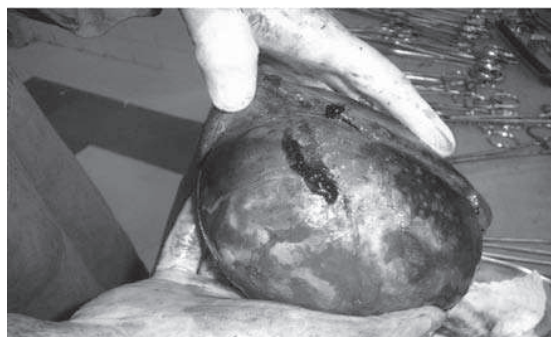
Figura 2: Espécimen quirúrgico: Bazo con quiste paraesplénico incluido.