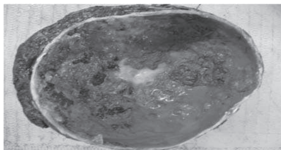
Figura 3. Bazo con corte parcial con quiste unilocular de 12 cm. y consistencia achocolatada

A la microscopía se observó un quiste esplénico con pared fibrosa, hialinizado y extensamente calcificado. Parénquima circundante sin alteraciones histológicas significativas. ( Figura 4 ).