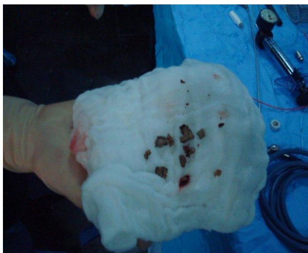
Figura 2. Fragmentos de litiasis extraídos vía percutánea luego de la nefrolitotripsia con láser de Holmium del lito en pelvis renal de 4 cm.