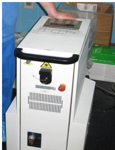
Figura 1. Equipo de Holmium Laser (New Star® 18W model)

La litotripsia láser se realizó in situ dentro del cáliz renal inferior y el único fragmento residual retirado fue de 5mm en su eje mayor (8,9) ( Figura 4 ).