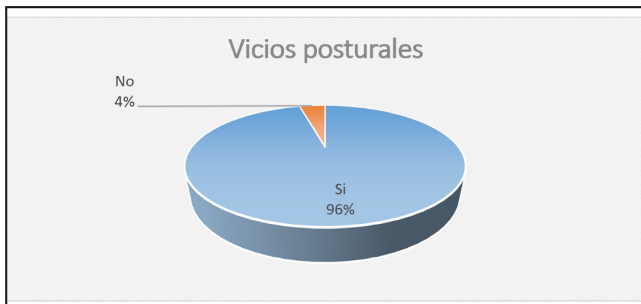
Gráfico 1. Representación de los vicios posturales encontrada en el estudio