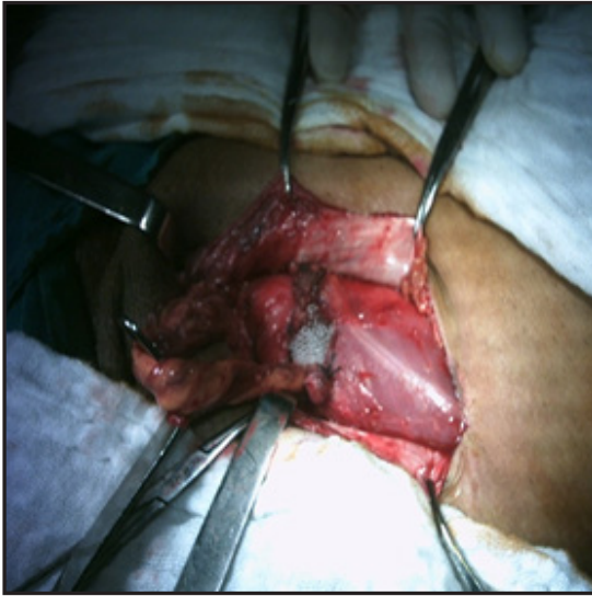
Figura 3. Plug asegurado en orificio inguinal profundo