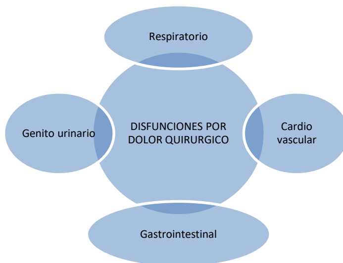
GRAFICO 2 Disfunciones por dolor quirúrgico