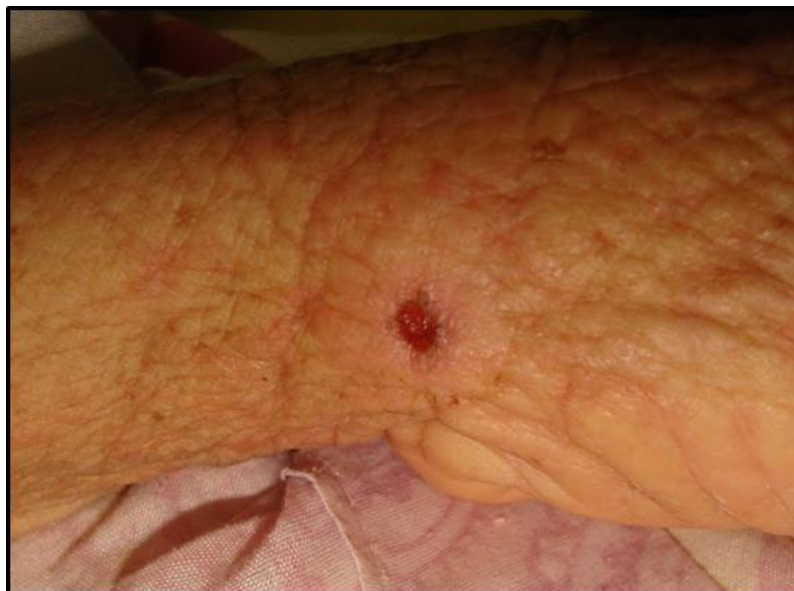
Figura 2. Lesión ulcerosa en muñeca izquierda.