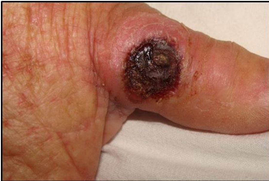
Figura 1. Lesión ulceronecrotica inicial en dedo pulgar, de mano derecha.

Al examen físico se observa placa eritematosa ulceronecrotica, con costra hemática, de bordes regulares, límites netos, de 1,5 cm de diámetro en región dorso-lateral de pulgar de la mano derecha ( Figura 1 ) y otra de menor tamaño de similares características en muñeca izquierda ( Figura 2 ). En región nasal infiltración con ulceración en fosa nasal derecha, de bordes irregulares, límites netos, con secreción viscosa. ( Figura 3 ) En mucosa palatina superior placa infiltrada con área necrótica que perfora el paladar ( Figura 4 ).