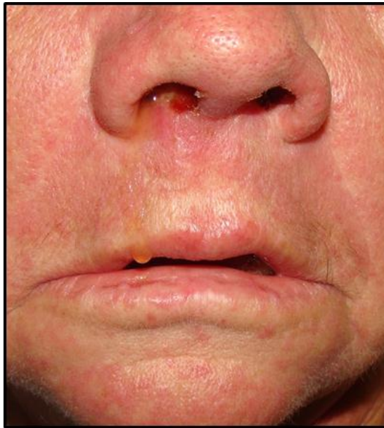
Figura 3. Infiltración en zona nasal y perinasal, insinuándose úlcera en fosa nasal. Nótese la secreción viscosa.