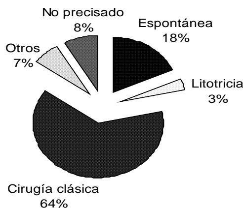
Figura 1. Modos de eliminación de cálculos urinarios de pacientes que acudieron al IICS, Paraguay 2007.

El 48% de los pacientes (n=24) eliminó múltiples cálculos, variando de 2 hasta 50 elementos o fragmentos por individuo y en 6% (n=3) se examinó material amorfo, no pudiendo identificar el número de elementos.