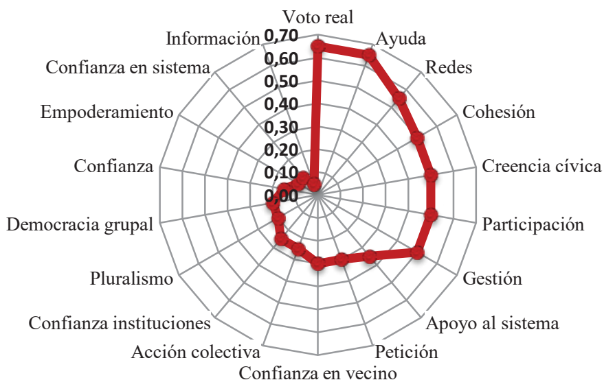
Figura 2. Morfología del Capital Social, Paraguay (2013)

* Los porcentajes son los valores totales de los grupos de municipios, divididos por el máximo posible, que sería máximo de CS.